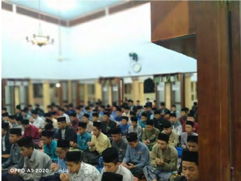
Suasana Ibadah Jamaah Sholat Maghrib di Masjid IMBS Miftahul Ulum Pekajangan