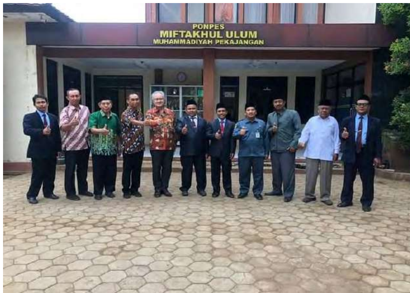
Kunjungan Dubes Jepang untuk Indonesia di IMBS Miftahul Ulum Pekajangan