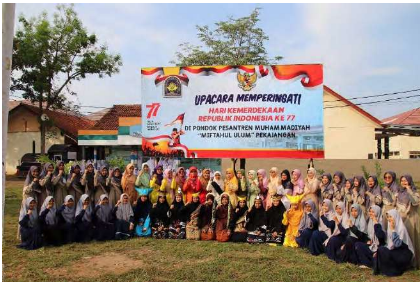
Santri IMBS Miftahul Ulum Pekajangan Tahun 2022