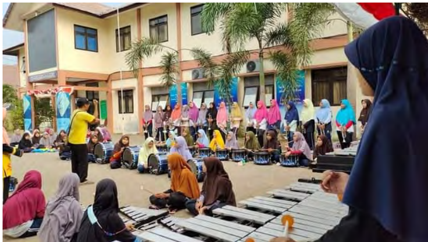
Latihan Marching Band putri IMBS Miftahul Ulum Pekajangan Guru-guru IMBS Miftahul Ulum Pekajangan 2022