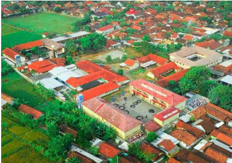
Pesantren IMBS Miftahul Ulum Pekajangan tampak dari atas