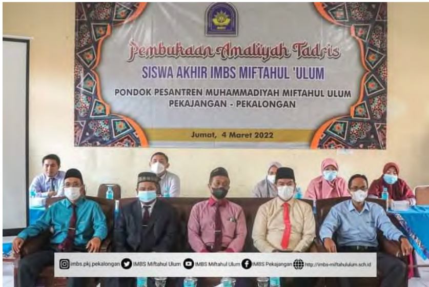
Pembukaan Amaliyah Tadris Kelas 6 IMBS Miftahul Ulum Pekajangan