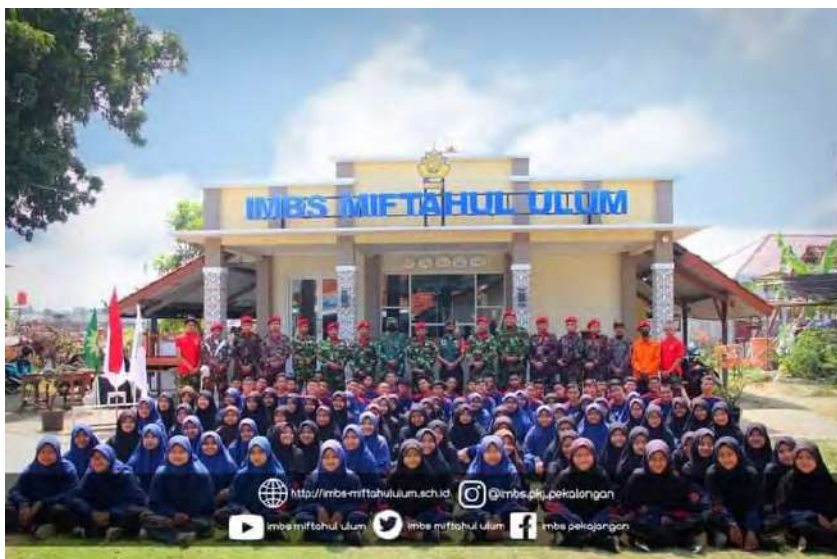
Pelatihan Kokam IMBS Miftahul Ulum Pekajangan