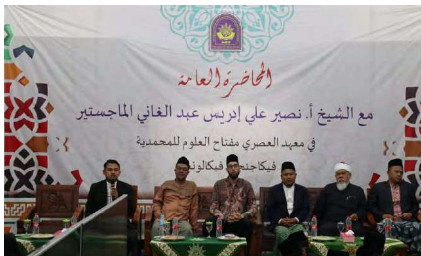
Kunjungan Syeikh Timur Tengah di IMBS Miftahul Ulum Pekajangan